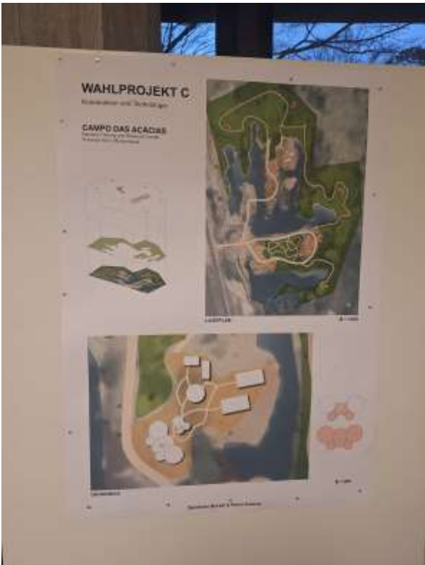
dass er kurze Hand seine Studierenden im darauf folgendem Semester