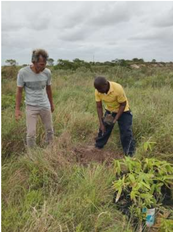
der Verpflanzung der Setzlinge aus der Baumschule auf

In the first phase of the Matutuine Bamboo Park project, planting plans were drawn up and agreements were concluded with official bodies for the reforestation of degraded areas between Maputo and Ponta D'Ouro. Shortly after the seminar ended, the second generation of seedlings was ready for transplanting. Many local helpers got involved in