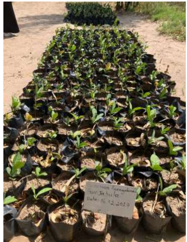
fruchttragende Bäume, die Hanglagen stabilisieren ( Garcinia livingstonei ),