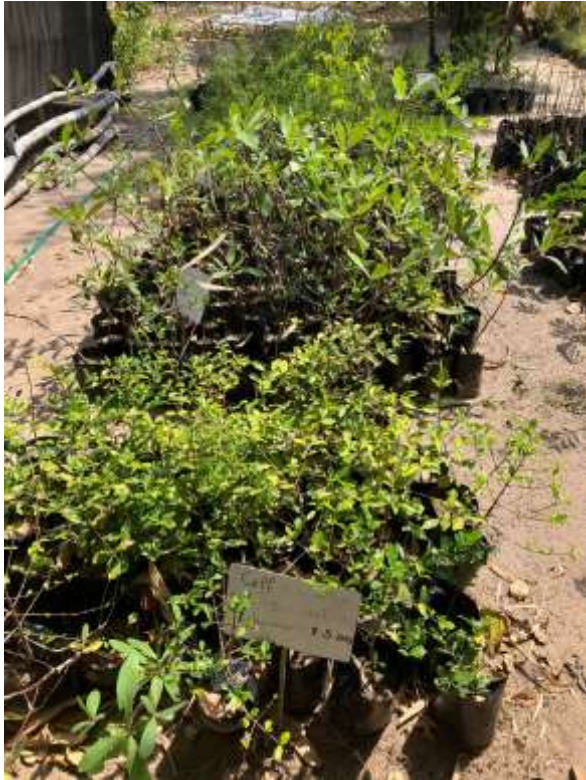
Kaffeepflanzen ( Coffea abyssinica ) für den Anbau im Agroforst-System,

fruit-bearing trees that stabilise slopes ( Garcinia livingstonei ),