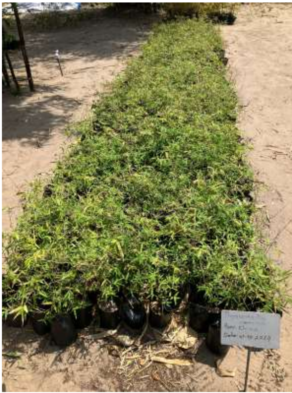
Derweil wuchsen in der projekteigenen Baumschule neue Bambussetzlinge (hier Thyrsostachys siamensis ),

Meanwhile, new bamboo seedlings (here Thyrsostachys siamensis ) grew in the project's own nursery,