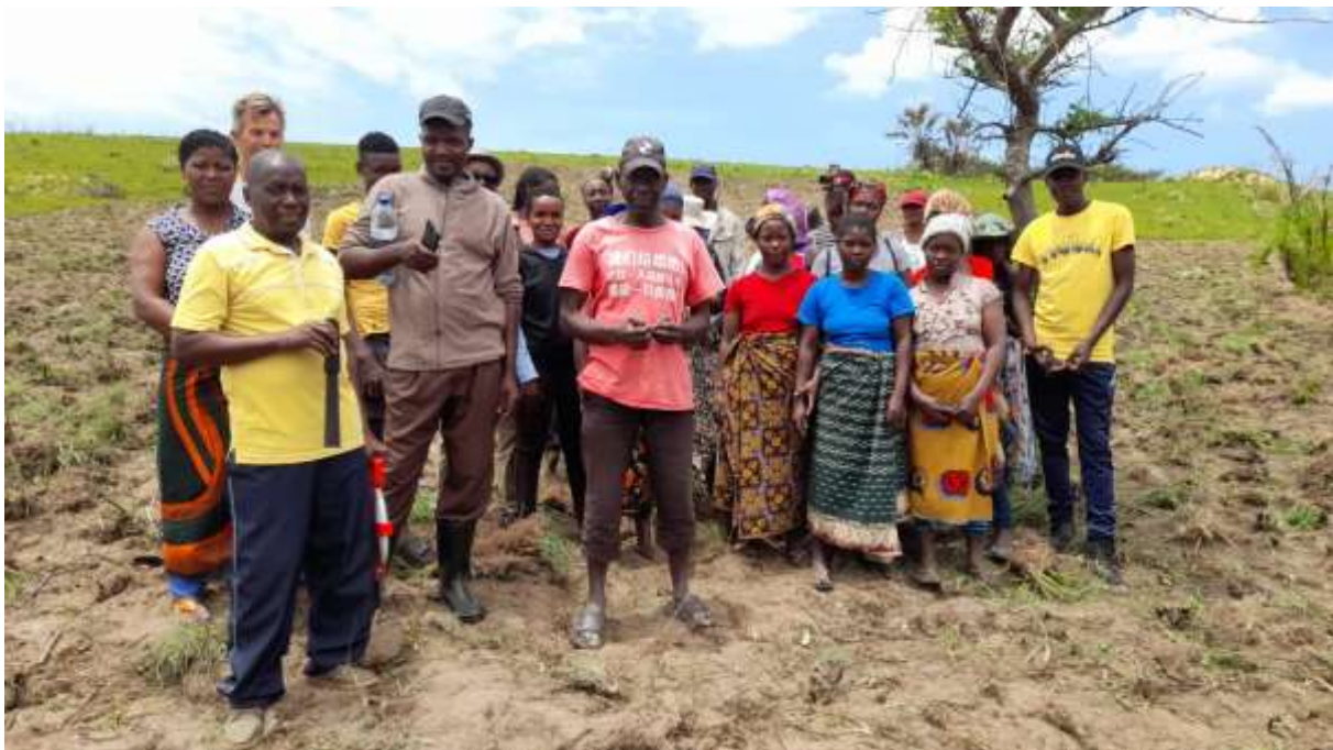
In der ersten Phase des Matutuine Bambuspark Projektes wurden Pflanzpläne erstellt und Vereinbarungen mit offiziellen Stellen zu Aufforstung der degradierten Flächen zwischen Maputo und Ponta D'Ouro geschlossen. Kurze Zeit nach Beendigung des Seminars war die zweite Generation Setzlinge für die Verpflanzung bereit. Viele lokale Helfer engagierten sich bei

and ornamental trees typical of the region ( Albizia adianthifolia ), which store nitrogen from the atmosphere.