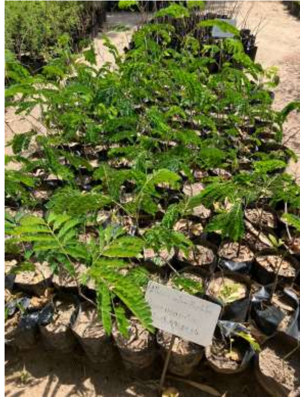
und für die Region typische Zierbäume ( Albizia adianthifolia ), die Stickstoff aus der Atmosphäre speichern.

coffee plants ( Coffea abyssinica ) for cultivation in agroforestry systems,