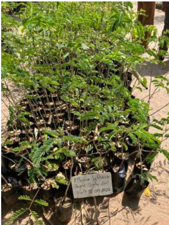
Bäume mit hohem medizinalen Nutzen ( Albizia lebeck ),

as well as native tree seedlings such as Adansonia digitata – baobab,