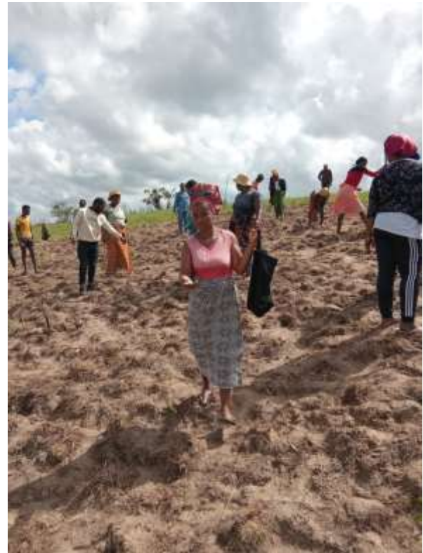
den zuvor vorbereiteten Flächen.

the transplanting of seedlings from the nursery to