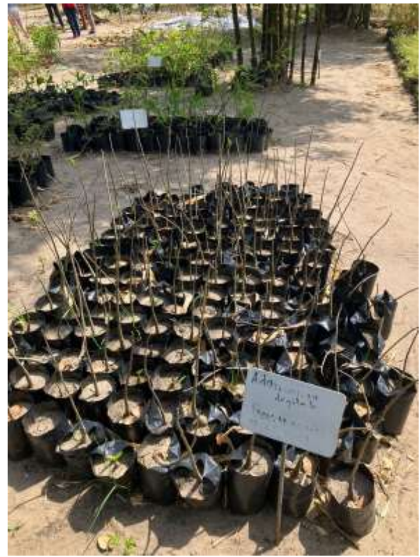
sowie ein einheimische Baumsetzlinge wie Adansonia digitata – Baobab

Meanwhile, new bamboo seedlings (here Thyrsostachys siamensis ) grew in the project's own nursery,